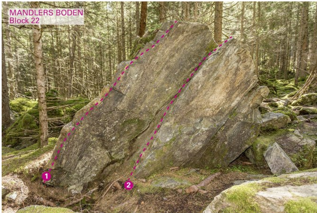
MANDLERS BODEN Block 22